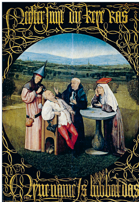
Hieronymus Bosch: A kőoperáció, 1490 körül. Prado, Madrid

A következő évek során a különböző szenvedélybetegségek, az alkoholizmus (LAM 1993/10. szám), a dohányzás (LAM 1994/4. szám), a túltápláltság vagy pontosabban a mértéktelen zabálás (LAM 1997/1. szám), illetve ezek gyakran kifejezetten komikus, szatirikus hangvételű ábrázolásai is terítékre kerültek. Orvostörténeti vonatkozású írásaim között szintén külön kategóriát képeztek