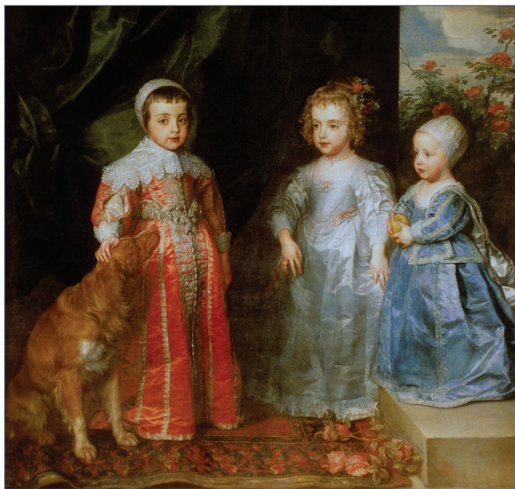
Anthonis van Dyck: I. Károly angol király három gyermeke, 1635. Galleria Sabauda, Torino

Nemritkán egy érdekes könyv megjelenése, vagy éppen egy aktuálisnak számító hazai vagy külföldi kiállítás adta az ötletet, illetve az ihletet egy-egy újabb írás elkészítéséhez. Ebbe a kategóriába tartoztak olyan ismertetéseim, illetve tanulmányaim, mint például a Könyvekről: Dörnyei Sándor, Régi magyar orvosdoktori értekezések (LAM 1999/5. szám), Egy orvos, akire emlékezni fognak: Gustav Rau (LAM 2001/2. szám), Plinius, a polihisztor (LAM 2002/9. szám), Van Gogh patográfiája (LAM 2004/6. szám), Sloane doktor és a British múzeum (LAM 2007/8–9. szám), vagy éppen a Dokumentált agónia, Ferdinand Hodler képei (LAM 2008/11. szám). Utóbbi a svájci szimbolizmus kiváló svájci képviselőjének műveiből a Szépművészeti Múzeumban rende-