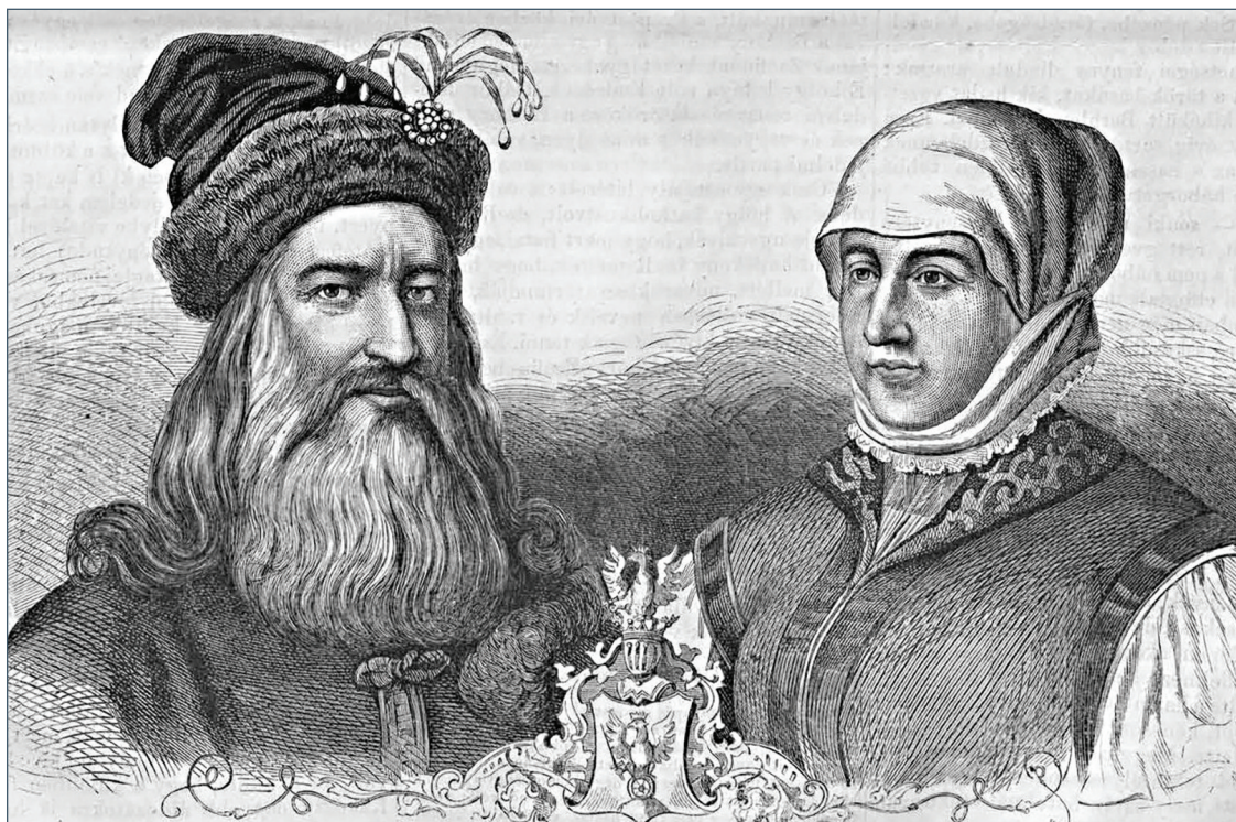
I. Rákóczi György erdélyi fejedelem és felesége, Lorántffy Zsuzsanna. Rusz Károly metszete (Vasárnapi Újság, 1867. szeptember 15.)

és ezzel menteni az országot... A magyar nők helyzete tehát »üditő kivétel volt« – nem csak a 17. században, hiszen az Árpád-korban a magyar asszonyoknak lehetett saját vagyonuk, örökölhettek és adományozhattak, a férfiági öröklést csak az Anjou-korban vezették be. De jóval később, a kora újkorban szintén élveztek némi önállóságot a nők házasságuk után is, ezt jelzi, hogy megtartották leánynevüket. Ez a szokás pedig egészen a 18. századig érvényben volt. Özvegyasszonyként teljesen függetlenné váltak, ők irányították a birtokokat, gyermekeik gyámjai is ők voltak.” Ennek a nagyasszonyi szerepkörnek, ennek a munkának volt egyik letéteményese a 17. században Lorántffy Zsuzsanna.