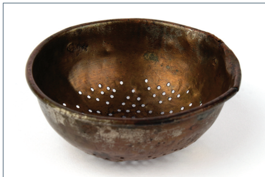
Gyógyszeres tégely (Simmelweis Orvostörténeti Múzeum)

A fennmaradt iratok elemzése és az ásatásokon fellelt maradványok alapján szépen kirajzolódott a termesztett és a felhasznált termények skálája: „A feldolgozott összeírásokban előforduló gabonafélék: búza, dézsmabúza, árpa, köles, rozs, zab, tatárka. A következő gyümölcsök is szerepelnek az írott forrásokban: aszalt gyümölcsök (szilva, alma, cseresznye, meggy, barack, som, füge, kökény, szőlőmazsola), dió, egres, vadkörte, vadalma, cseresznye, alma, barack, szilva, különböző liktáriumok (szilva, barack, birsalma, szekfüves körte). Említést tesznek zöldségnövényekről is: tök, cékla, káposzta, retek, petrezselyem, borsó, torma, lencse, vöröshagyma, mogyoróhagyma, fokhagyma, uborka, fehérrépa, sárgarépa, görög-dinnye. Az összeírásokban szerepelnek ételmaradványok (kása, köleskása, tatárkása) is, kenderés lenmag, komló, tölgyemakk, gyömbér, bors, nádméz, fahéj, fenyőmag, kapormag, búzaliszt,