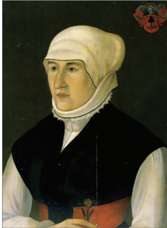
Lorántffy Zsuzsanna portréja (ismeretlen szerző)

17. századi helyzetkép: „...eb a török, kutya német és ezek ketten megemésztenek bennünket” – írta egyik levelében Bethlen Miklós (1642–1716) Teleki Mihálynak (1634–1690) 1677-ben. Ez a fél mondat röviden és kifejezően jellemzi azt az áldatlan állapotot, ami Magyarországon a három részre tagolt ország korában uralkodott. A lakosság körében igen nagy volt az ínség minden tekintetben, hanyatlás jellemezte a kultúrát, a tudományokat, elvétve lehetett csak orvost, patikust találni.