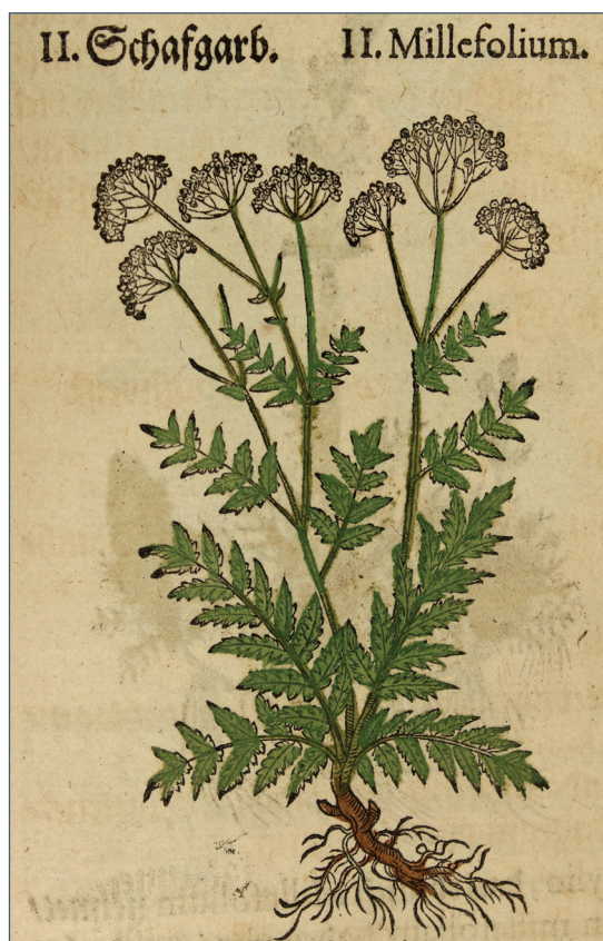
Cickafark (Simmelweis Orvostörténeti Múzeum)

A késő reneszánsz kori Magyarországon, a békésebb területeken, minden nehézség ellenére virágzott a kertkultúra. Ez egy egyelőre még kevésbé kutatott területe múltunknak, de a forrásanyagok, a gazdagon fennmaradt családi levelezések, leltárak, végrendeletek módot adnak arra, hogy feltáruljon kultúránk ezen kevésbé ismert része is. A korban a főúri lét szerves részévé váltak a kertek, melyek nemcsak reprezentatív, esztétikai jelentőséggel és jelleggel bírtak, hanem – különösen a gyümölcsfák, zöldségek és gyógynövények tekintetében – számottevő gyakorlati értékkel is rendelkeztek. A korszak kertjei a reneszánsz kert ismerveinek megfelelően épültek fel. A magyar vonatkozásokba legtelje-