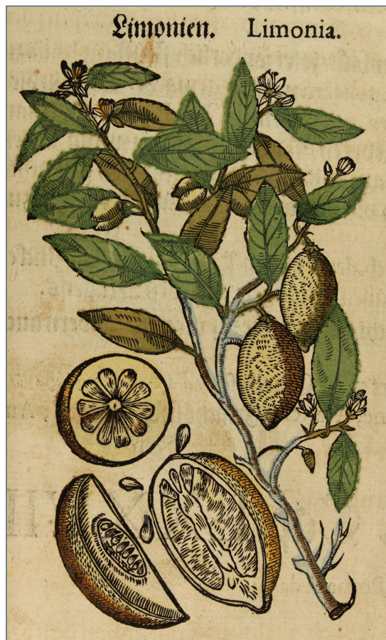
Citrom (Sommelweis Orvostörténeti Múzeum)

hogy levelében azt ígérte feleségének, hacsak tudja, felfogadja a kertészt és fiát, hogy Erdélyben nekik hasonló szépségű kertet építsenek. „Az elmúlt szerdán valék egy kertben ott Morvában, ki fel való táborunkhoz egy annyi föld mind Vajasd Fejérvárhoz, vagyon 60 esztendeje hogy kezdették volt építeni, kinek mását nem hiszem senki szeme láthatta, én csak helyét is elmémmel se egész Magyarországon, Erdélyben az kit láttam fel nem tanálhatom, s meg sem tudom hirtelen írni mind szépségit, alkalmatosságit; ha lehetne azon volnék az kertészét elvitethetném, fiával együtt” – áll az 1645. augusztus 6-án keltezett levelében. Még a harcok közepette is volt ideje Rákóczi Györgynek, hogy a kerteket megfigyelje. 1644. július 1-jén keltezett levelében írta feleségének, hogy „Palocsa várát is tegnap vötték meg vitézink, az itt való virágos kert tűrhető képen maradt”.