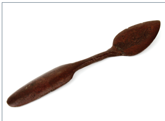
Kenőcskanál (Semmelweis Orvostörténeti Múzeum)