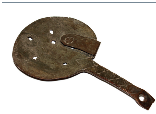
Szűrő (Semmelweis Orvostörténeti Múzeum)

vényeiről: szederlevél hajmosásra, fekete gyopár fogfájás ellen, rózsavíz illatszerül és gyógyszerként. Használt hársvirágot, levendulát, fodormentát, gyógyított vesét, májat, szívet. Készített körömvirág szirumból vajban pirítva kenőcsöt gennyes sebekre..., a szirmokból készült teával pedig gyomorfekélyt gyógyított.” „A gyógynövényekből készültek a híres párlatok, aszalványok, fűszerek és orvosságok, melyekből nemcsak a várbelieknek, de a bárhonnan érkező rászorulóknak is jutott, akiket a fejedelemasszony maga ápolt.”