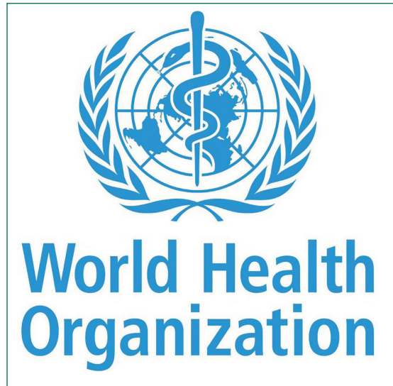
1. ábra: A WHO logója (URL1)

1945. április 25-én kiküldött 16 tagú bizottság végezte el.” – számolt be róla a Magyar Orvosok Szabad Szakszervezetének korabeli hivatalos folyóirata és a Népegészségügy , a közegészségügyi igazgatás közlönye (Orvosok Lapja, 1947).